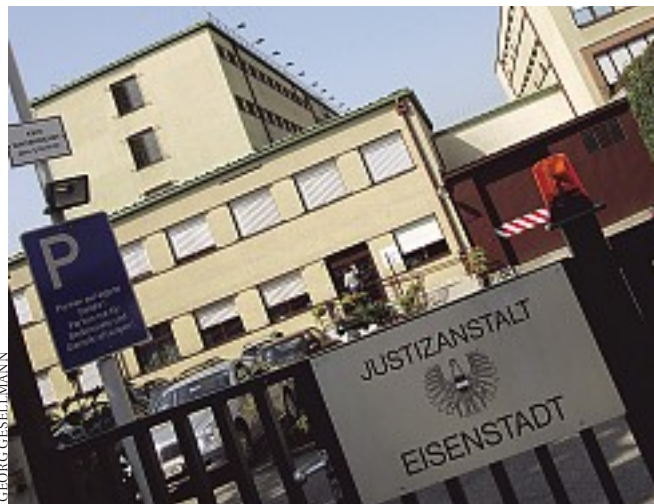
Die Justizanstalt könnte zum Wahlkampfthema in Eisenstadt werden

Gesetz Die Justizanstalt in Eisenstadt bietet derzeit für 163 Personen Platz. 90 Prozent von den Insassen sind in Straf- oder Untersuchungshaft. Das Verhältnis beträgt 50 zu 50. Insgesamt sind nur acht Prozent Schubhäftlinge. Warum überhaupt ein Gefängnis in Eisenstadt sein muss, hängt mit der gesetzlichen Lage zusammen. Überall dort, wo es ein Landesgericht gibt muss auch eine Justizanstalt angeschlossen sein.